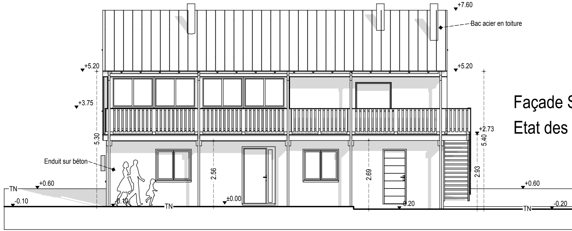
Façade Sud Etat des lieux